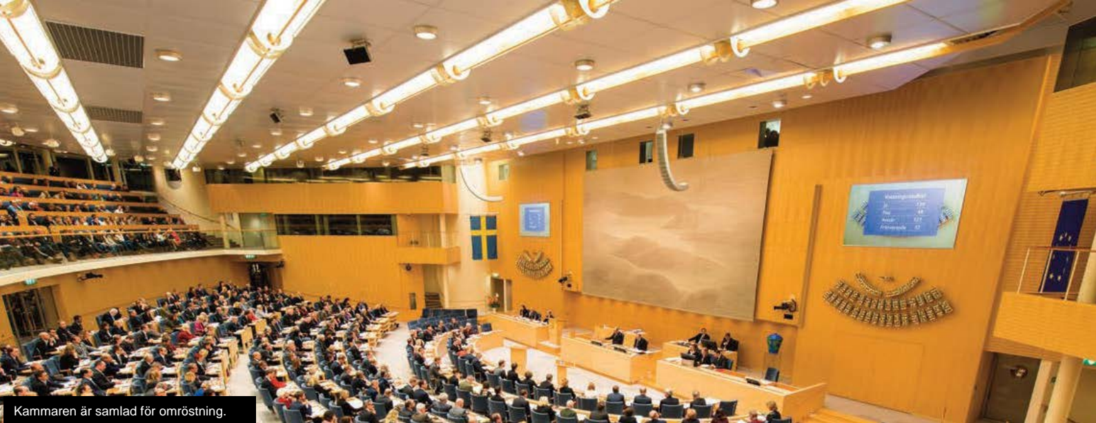
Kammaren är samlad för omröstning.