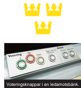
Voteringsknappar i en ledamotsbänk.

Dowladda ayaa hogaamisa Iswiidhan ayadaana siisa lacag iyo shaqo hey'adaha dowladda