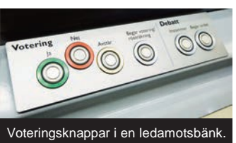
Voteringsknappar i en ledamotsbänk.

Regeringen styr Sverige och ger både pengar och uppdrag till myndigheterna.