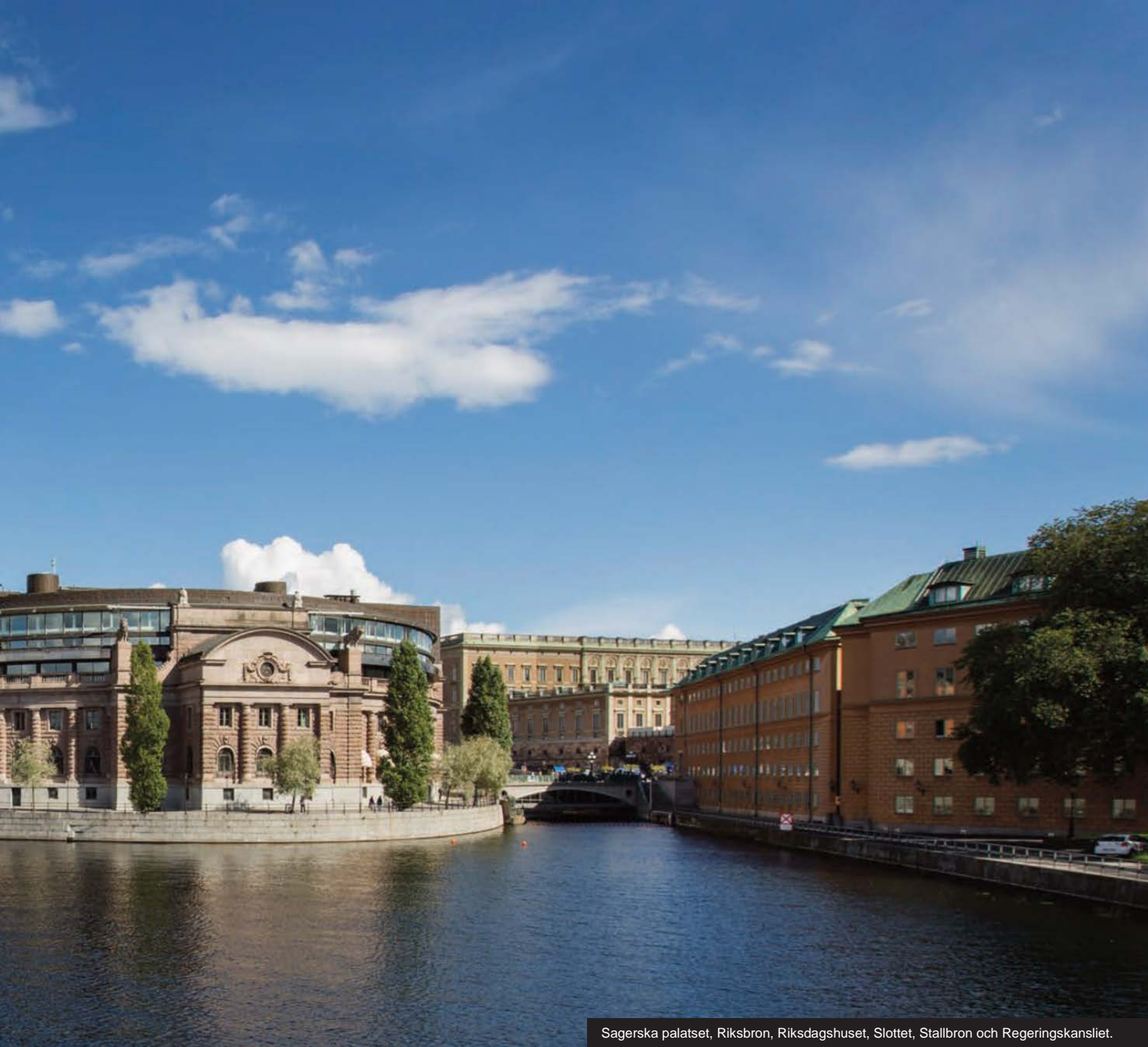
Sagerska palatset, Riksbron, Riksdagshuset, Slottet, Stallbron och Regeringskansliet.

regeringen Regeringskansliet, med departement för olika områden, och de statliga myndigheterna. Regeringen kan styra hur myndigheterna ska arbeta. Men, regeringen får aldrig styra över hur myndigheten använder lagarna. I många andra länder har ett statsråd makt att direkt ingripa i myndigheternas löpande arbete. I Sverige är det inte så. Detta brukar kallas att vi har förbud mot ministerstyre.